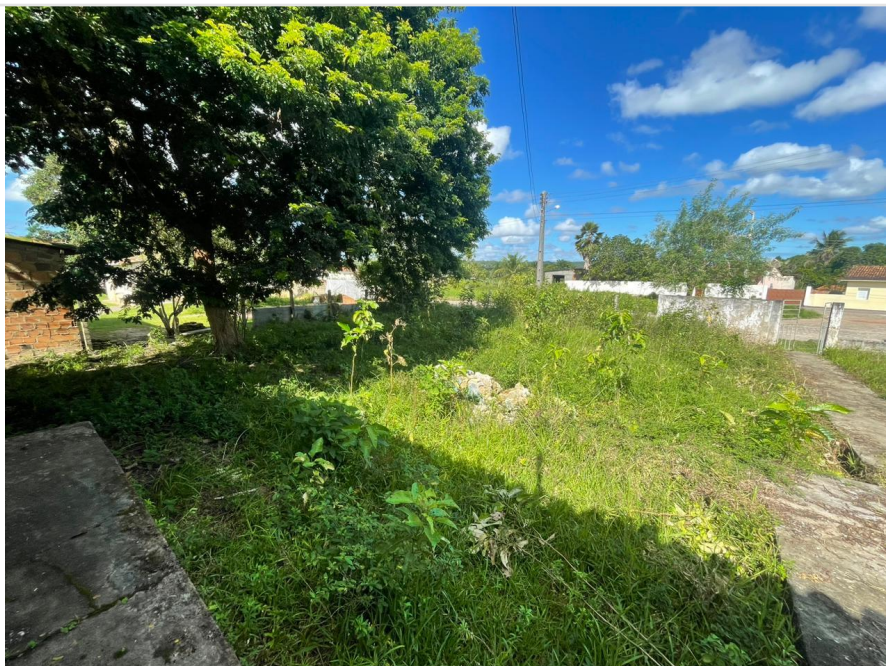
Data da última atualização: 10/05/2023