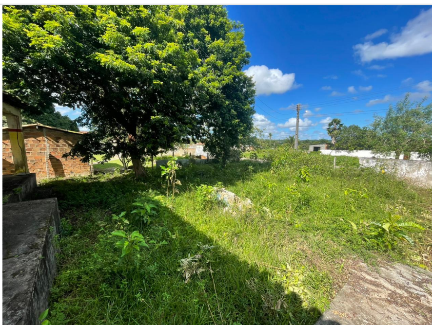
Data da última atualização: 10/05/2023